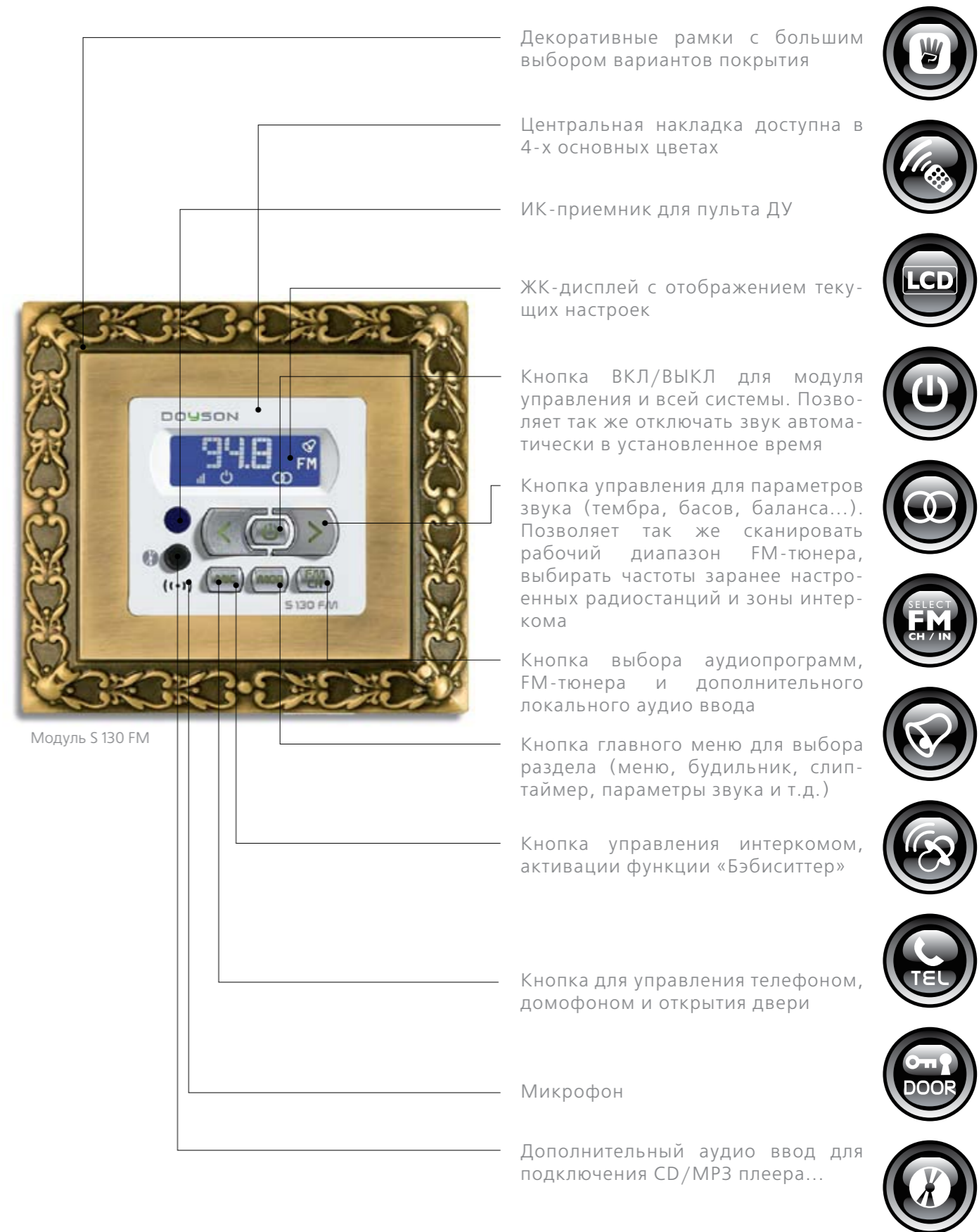
Модуль S 130 FM

Декоративные рамки с большим выбором вариантов покрытия